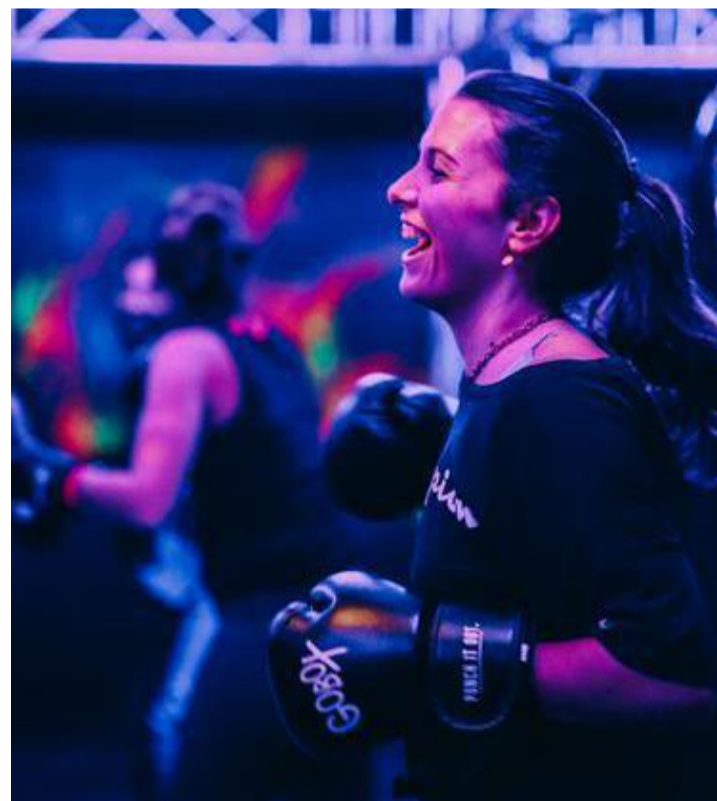
90 % de femmes.

Pour l'ambiance, le décor et la lumière rappelle les dance-floors des discothèques. Trois playlists sont disponibles. Cela