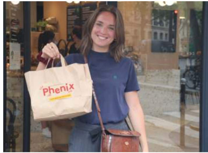
Depuis près d'un an, Phenix est actif à Bruxelles.

Depuis le mois de juin à Bruxelles, Phenix a sauvé 75.000 repas qui auraient été jetés à la poubelle. L'application contre le gaspillage alimentaire épargne 127.000kg de CO2, soit l'équivalent de 1270 vols de Bruxelles à New York.