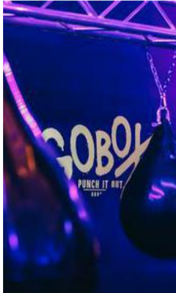
A Schuman.

Niveau prix, Gobox offre aux nouveaux inscrits un discovery pack à 30 euros pour 3 sessions. Les membres peuvent ensuite profiter de l'offre de lancement à 79 euros par mois pour un abonnement illimité annuel ou le pass de 10 sessions à 160 euros. Les gants de boxe peuvent être empruntés gratuitement et sont désinfectés